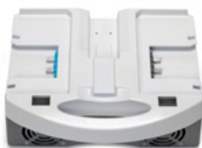
i-charge 9 (3 unidades)