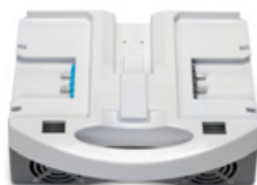
i-charge 9 (3 pièces)