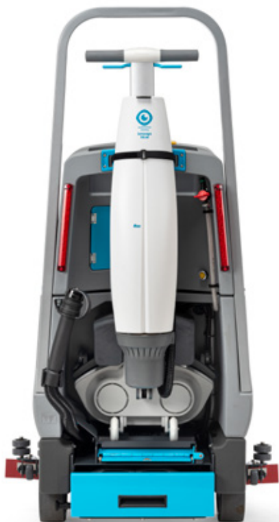
i-drive + imop Lite