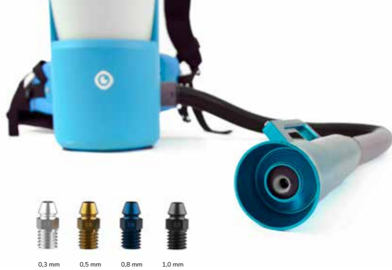
4 forskellige mundstykke størrelser 20-150 mikron

Med de udskiftelige mundstykker kan du regulere tågen fra 20 til 150 mikron dråbestørrelse efter behov. Tågen svæver gennem luften og dækker alt, hvad den kommer forbi. Ideel til at angribe mikroorganismer og vira på overflader og i atmosfæren.