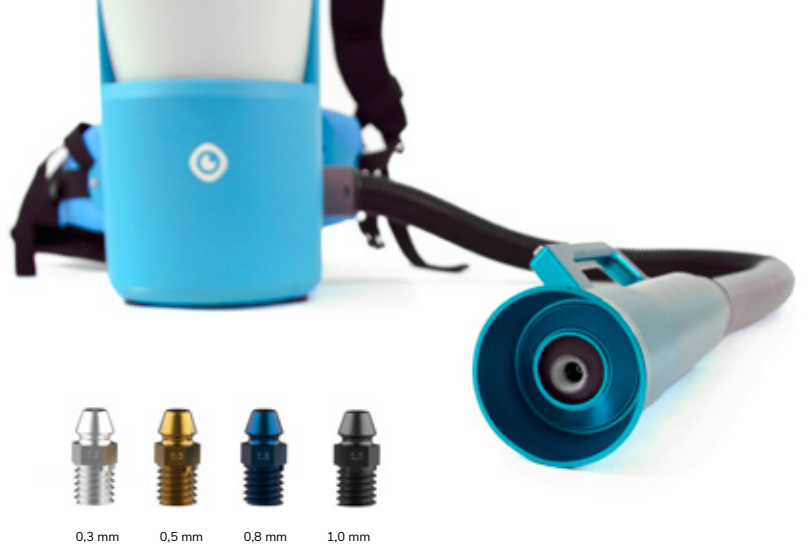
4 tamaños de boquilla diferentes 20-150 micrones

Con las boquillas intercambiables puedes regular el tamaño de gota de niebla de 20 a 150 micrones según sea necesario. La niebla flota en el aire y cubre todo lo que encuentra. Ideal para atacar microorganismos y virus en superficies y en la atmósfera.