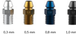
Mondstukken in 4 verschillende formaten 20-150 micron